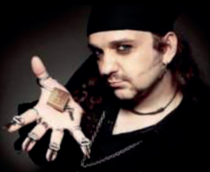
Greca, día 15